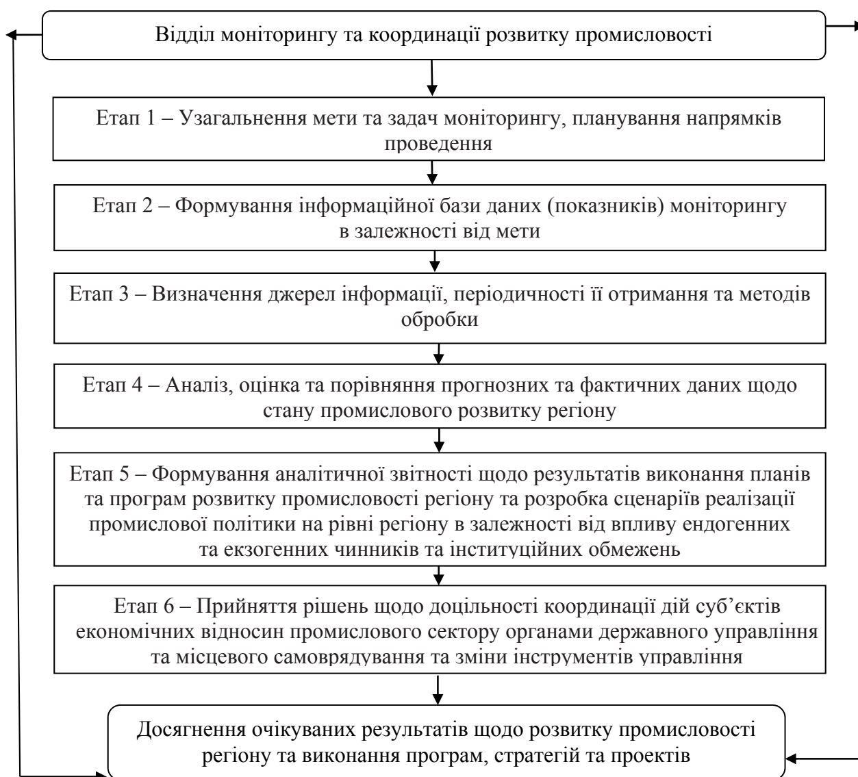
Рис. 2. Етапи організаційного забезпечення відділу моніторингу та координації розвитку промисловості

Впровадження моніторингу оцінки рівня промислового виробництва та економічного розвитку за системою відповідних критеріїв та індикаторів пропонується покласти на відділ моніторингу та координації розвитку промисловості. Етапи організаційного забезпечення відділу моніторингу та координації розвитку промисловості представлені на рис. 2.